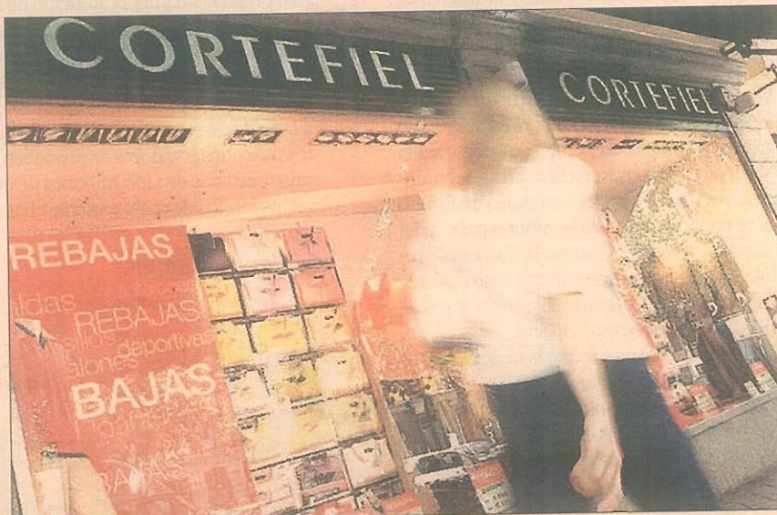
Cortefiel está desarrollando un modelo de tienda más eficiente.

El grupo Cortefiel, controlado por las firmas de capital riesgo CVC, PAI y Permira, que adquirieron la compañía de la familia Hinojosa en 2005, quiere dar su definitivo salto internacional. Planea desembarcar en Estados Unidos y Reino Unido consolidando sus marcas Cortefiel, Milano y Pedro del Hierro, que van algo rezagadas en internacionalización respecto a sus buques insignia Springfield y Woman Secret, presentes ya en 46 y 38 países, respectivamente. El plan de expansión incluye también la captación de talento extranjero. El grupo no descarta dar entrada a socios o volver a salir a bolsa. Pág. 3. LA LLAVE