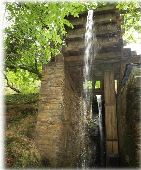
Ferrería de Penacoba: zona de la rueda hidráulica.

El proyecto ATLANTERRA, representa un primer estudio del potencial del patrimonio minero de toda Galicia. El concepto de patrimonio minero incluye todos los vestigios de las actividades mineras del pasado, reciente o lejano, a las que un grupo social atribuye valores históricos, culturales o sociales. Este proyecto internacional ha sido financiado por el Fondo Europeo de Desarrollo Regional (FEDER), a través del programa INTERREG IV B. Comenzó en 2010 y ha finalizado en diciembre de 2013. El conjunto del trabajo se ha desarrollado en regiones de cinco países incluidos en el Espacio Atlántico Europeo: Irlanda, Gales, Francia occidental, Galicia y Portugal. Han participado diez socios y, en el caso de Galicia, el Instituto Geológico y Minero de España ha sido el responsable del proyecto.