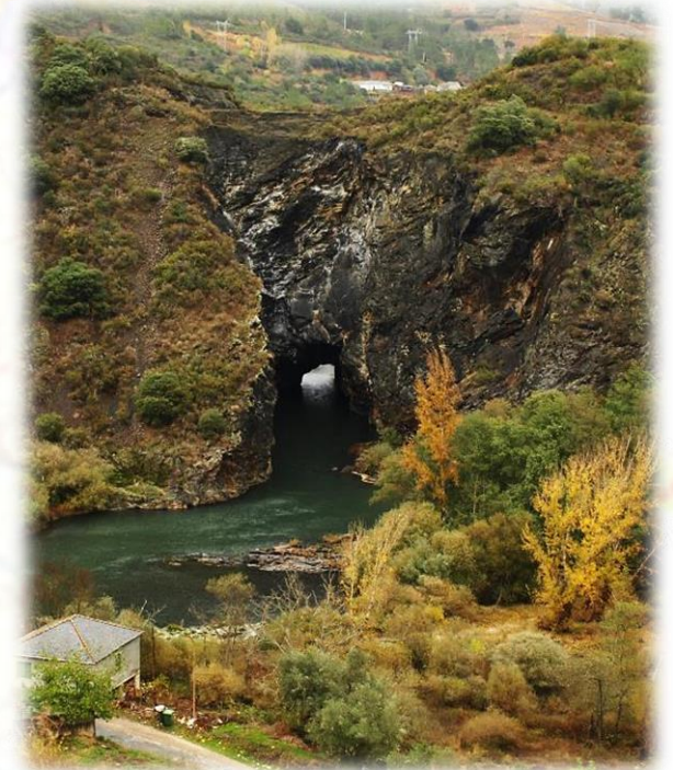
Túnel romano de Montefurado.

Uno de los productos resultantes del proyecto ATLANTERRA es el Mapa de Patrimonio Minero de Galicia , que se ha elaborado con el fin de difundir el conocimiento sobre el conjunto de restos y documentos heredados de la actividad minera y que son importantes para la comprensión de la sociedad minero-industrial en su conjunto o para mostrar el desarrollo y evolución de la actividad minera en la Comunidad Autónoma de Galicia.